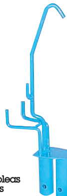
Elevador de poleas para cables 18110834