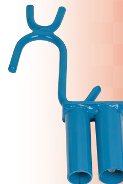
Herramienta elevadora de cables de doble punta 18110812